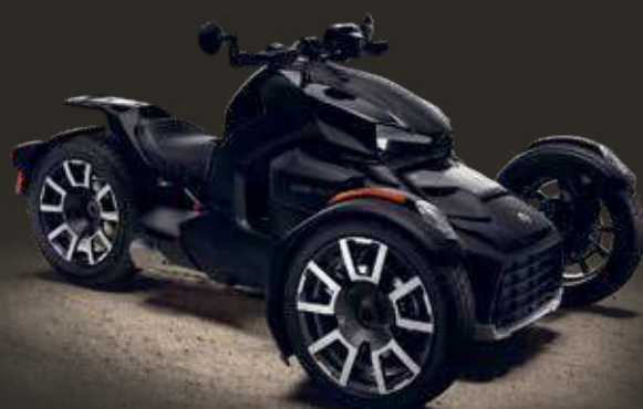
ВЕРСИЯ С ПАНЕЛЯМИ CLASSIC ЧЕРНОГО ЦВЕТА INTENSE BLACK

Выберите один из двух двигателей и оцените идеальное сочетание спокойствия, стабильности и производительности.