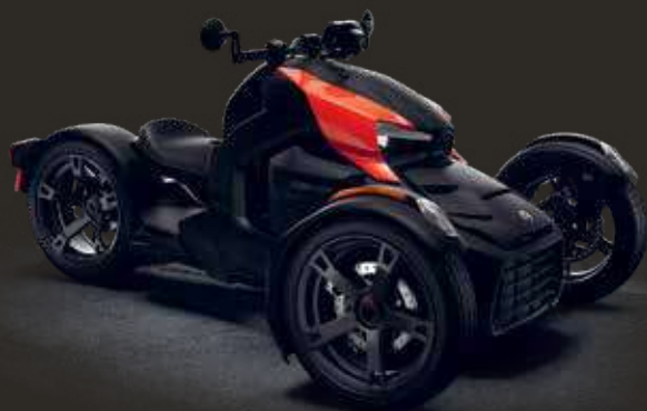
ВЕРСИЯ С ПАНЕЛЯМИ CLASSIC КРАСНОГО ЦВЕТА ADRENALINE RED

ВЫБЕРИТЕ ОДНУ ИЗ ДВУХ МОДЕЛЕЙ CAN-AM RYKER