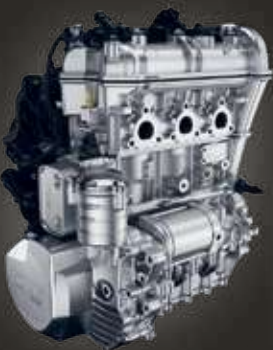
ДВИГАТЕЛЬ ROTAX 900 ACE

Обладая небольшой массой, изготовленный из долговечных перерабатываемых материалов, каждый Can-Am Ryker создан с учетом требований защиты окружающей среды, благодаря чему в вашем распоряжении окажется доступное, качественное и экологичное транспортное средство.