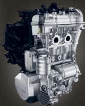
ДВИГАТЕЛЬ ROTAX 600 ACE